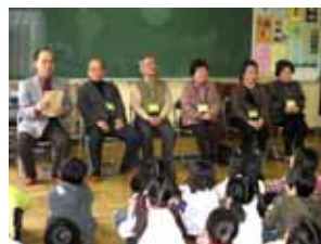
第二むつみ会との交流

皆様にご協力いただくことで、「くぬぎだタイム」などの学習を充実させることができました。毎回、子どもたちは皆様に教えていただくことを楽しみにしています。